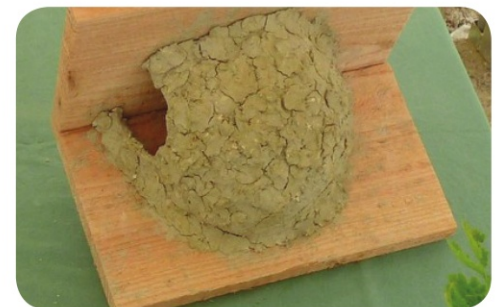
Nids «maison» d'Hirondelle rustique et d'Hirondelle de fenêtre