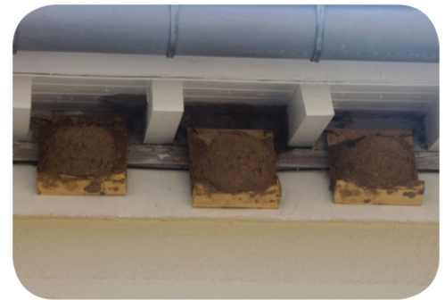
Nids fabriqués manuellement, Secteur de Chantilly (60)

L'Hirondelle de fenêtre Delichon urbicum et l'Hirondelle rustique Hironda rustica sont des espèces protégées par la loi. La destruction d'oiseaux et de nids (occupés ou non) est interdite. L'association Picardie Nature apporte les conseils pour faciliter la prise en compte de ces oiseaux.