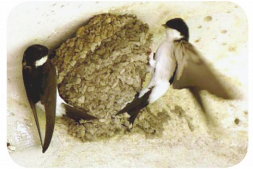
Adultes nourrissant les jeunes au nid, Secteur d'Ermenonville (60)

L'Hirondelle de fenêtre Delichon urbicum et l'Hirondelle rustique Hironda rustica sont des espèces protégées par la loi. La destruction d'oiseaux et de nids (occupés ou non) est interdite. L'association Picardie Nature apporte les conseils pour faciliter la prise en compte de ces oiseaux.