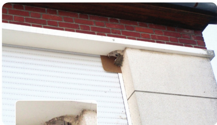
Hirondelle en train de se réinstaller, Secteur d'Albert (80)