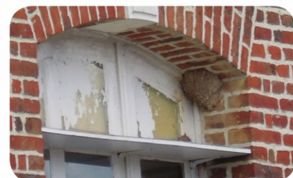
Nid d'Hirondelle de fenêtre, Secteur de Doullens (80) © S. Declercq