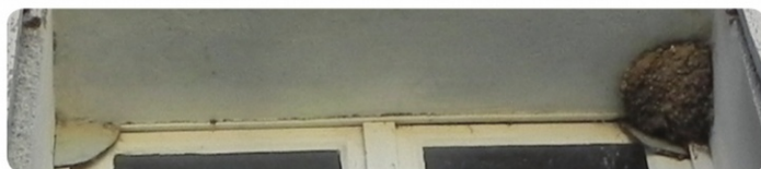
Nid d'Hirondelle de fenêtre, Secteur de Château-Thierry (02)

Dans la partie supérieure d'une fenêtre haute ou d'une porte c'est plus facile :