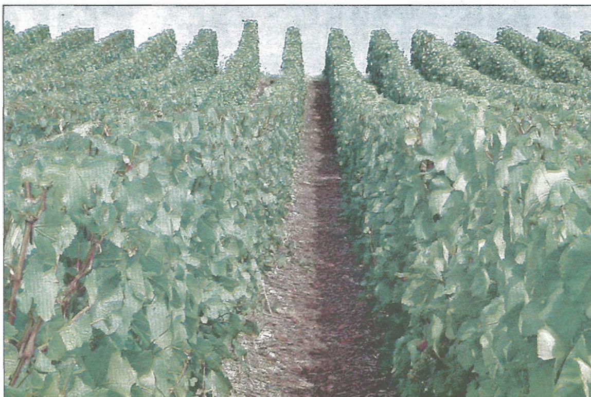
Comment concilier intérêts économiques et protection de l'environnement à Chartèves ? Là est tout le débat.

Depuis 1995, la situation est bloquée. Pour les propriétaires de parcelles à Chartèves, une quinzaine de viticulteurs, c'est la colère. « Il y a des orchidées partout sur les sols calcaires. Elles se ramassent à la pelle », explique l'un d'eux. Il y a 25 ans, ce vigneron a acheté 36 hectares à Chartèves et a obtenu toutes les autorisations pour cultiver la vigne. Entre-temps, la préfecture a gelé les procédures de foncier sur la zone. Aujourd'hui, ce vigneron ne cultive que 15 ares, soit 1 500 mètres carrés. Dérisoire. « Je suis en train de faire chiffrer le manque à gagner. C'est considérable. Nous devons être remboursés pour le préjudice subi. On ne