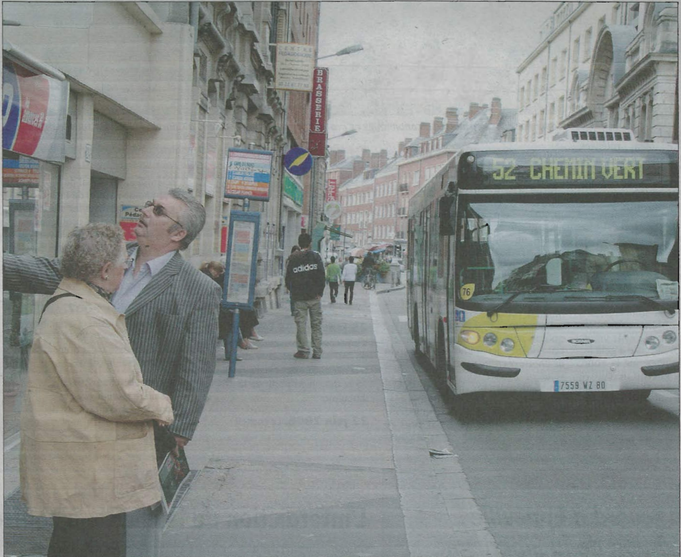
Rayées de la carte des transports urbains depuis 2008, les quatre lignes régulières ont retrouvé leur tracé sur l'ancien anneau vert.

AMIENS Chose promise... Depuis ce matin le réseau des transports urbains a repris ses droits au cœur de la ville. Page 6